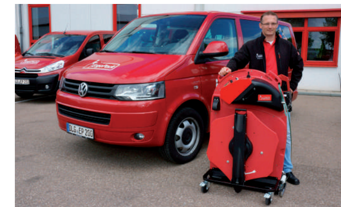
エルゴパック納品時には、操作方法を作業担当者様に直接伝授させていただきます。

今日では8,500台以上ものエルゴパックが、35カ国から世界へ販売されています。エルゴパックの操作は簡単です。操作方法や取り扱い方法等を納品の際に担当者がお客様にトレーニングをさせていただくことで、安心してお使いいただけます。エルゴパック 一名前がすべてを表しています：エルゴノミックにパレットと梱包物を一緒にバンド掛けする。エルゴパックにより、かがむことはもう過去のものです！