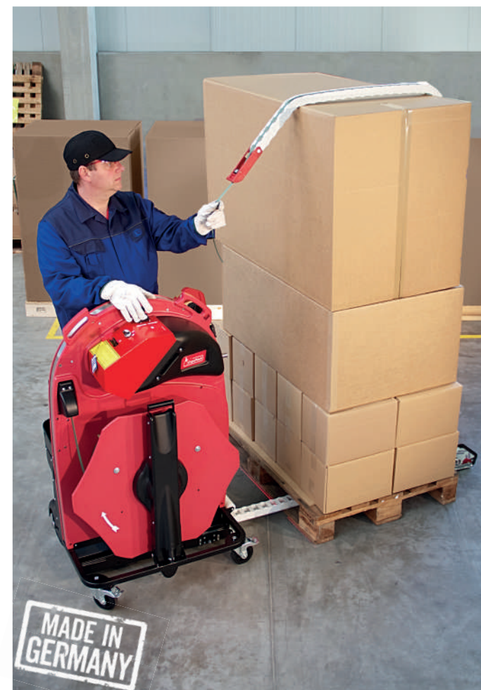
背の高い梱包対象物も、エルゴパックでバンド掛けが可能です。アタッチメントを装着すると、高さ3Mまで安全・確実にバンド掛けをします。