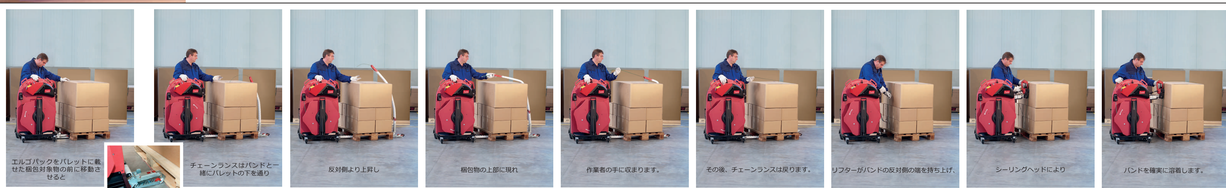
エルゴパックをパレットに載せた梱包対象物の前に移動させると