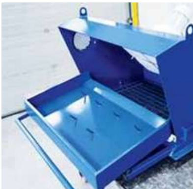
袋を固定するスパイク付排出装置