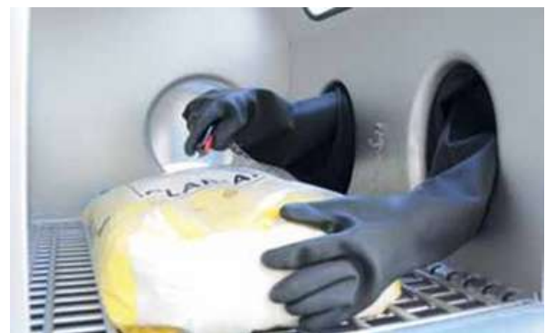
ガントレットと安全ナイフによる密閉キャビンでの袋の開封